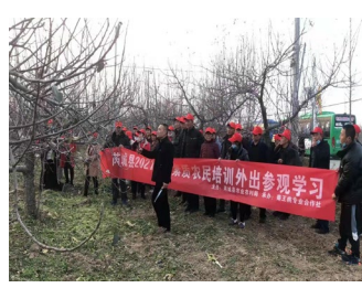
果树管理现场培训