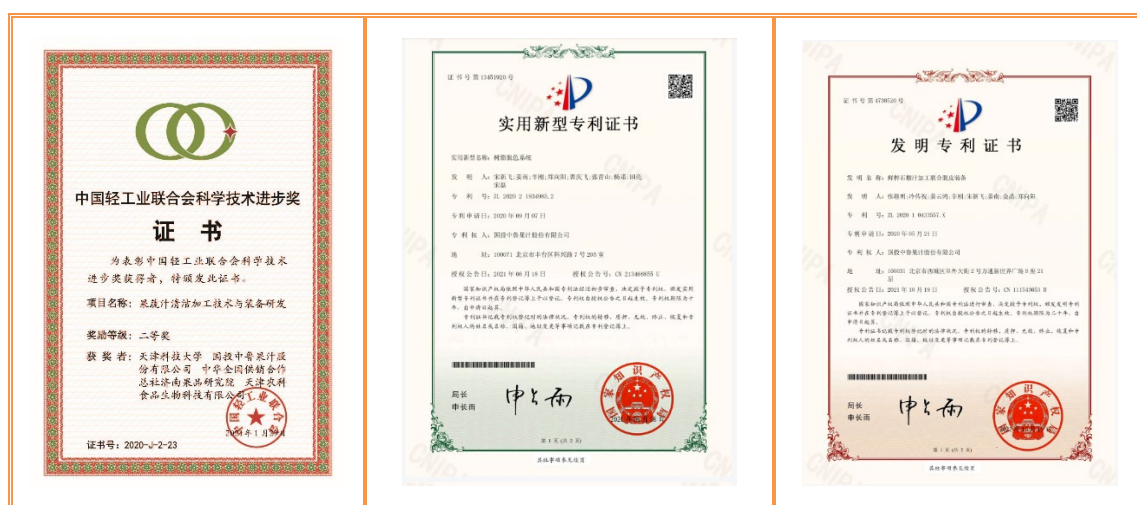
图表 6 公司部分荣誉

(5) 公司参与制定《非浓缩还原苹果汁》《非浓缩还原果蔬汁加工技术规程》《非浓缩还原果蔬汁冷链物流技术规程》《非浓缩还原果蔬汁用原料》4项农业行业标准，上述4项农业行业标准已于2021年发布。