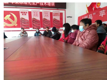
苹果标准化生产培训